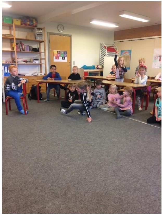
0. klasse vil rigtig gerne have besøg af Frøsnappere igen. Vi tænker over lidt mere samfærdsel.